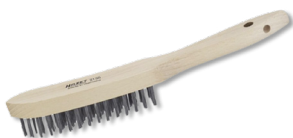
9 Drahtbürste zum Reinigen von Baum oder Pfahl Preis = 8€ ProduktNr: WP-0005