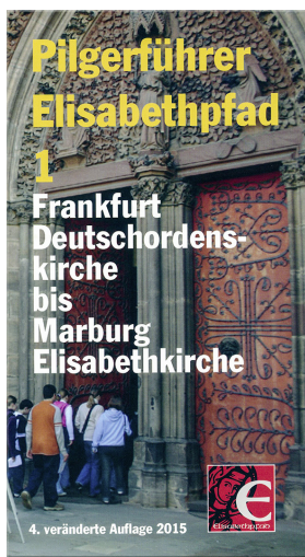
13 Pilgerführer 1 Frankfurt - Marburg Preis = 9,50€ PS-B10025