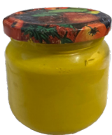
5 Gelbe Farbe: Rapsgelb in kleinen Schraubgläsern Preis = 2€ ProduktNr: WP-0001