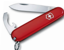
10 Kleines Messer zum Entfernen alter Klebefolien Reste Preis = 5,5€ ProduktNr: WP-0006