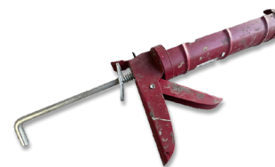
7 Spritze zum Verarbeiten des Montageklebers Preis = 4€ ProduktNr: -