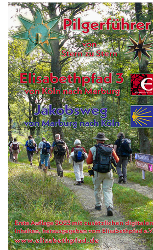
15 Pilgerführer 3 Köln - Marburg Preis = 15,80€ PS-B10034