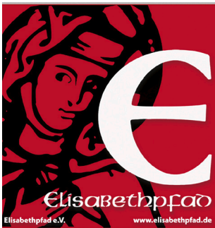
1 Elisabethpfad Pilgerzeichen Klebefolie 0,4 mm Preis = 2€ ProduktNr: Ek-B10109

Bitte in Adobe Reader öffnen, ausfüllen und mit dem Button „absenden+bestellen“ (Seite 2) auf den Weg bringen!