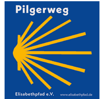
4 Jakobsweg Pilgerzeichen Aluschildplatte 3 mm Preis = 5€ ProduktNr: Ek-B10109