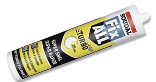
8 Montagekleber zum Ankleben der Aluschild-Wegezeichen Preis = 9€ ProduktNr: WP-0004