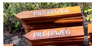
11 Holzschild Pilgerweg links - zum Anbringen an einen Posten Preis = 10€ ProduktNr: WP-0007