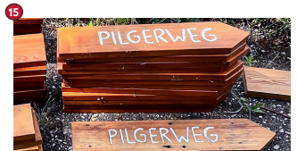
12 Holzschild Pilgerweg rechts - zum Anbringen an einen Posten Preis = 10€ ProduktNr: WP-0007