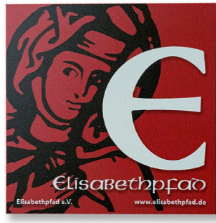
2 Elisabethpfad Pilgerzeichen Aluschildplatte 3 mm Preis = 5€ ProduktNr: Ek-B10109