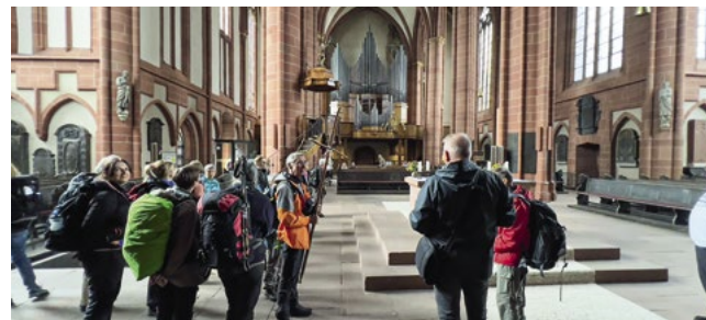
Pilger und Pilgerinnen entdecken gemeinsam den Dom von Wetzlar.

Bei diesen Fragen hilft die geistliche Gestaltung der Tage: in der Bibel lesen, beten, singen, schweigen, einfachen Lebensstil praktizieren, in einfachen Quartieren übernachten. Oft erleichtert und bereichert die Gemeinschaft einer Gruppe das Pilgern.