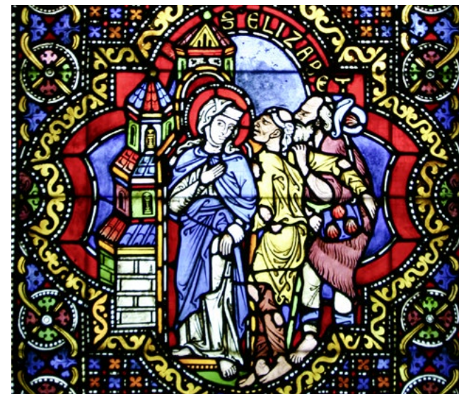
Elisabethfenster: Elisabeth nimmt Fremde und Pilger auf.

Immer wieder kann das kurze und bis heute beispielhafte Leben der heiligen Elisabeth anregen, Gott auf der Seite der Suchenden, der Armen und Kranken zu suchen und zu finden. Auf ihren Spuren zu gehen hilft, den Gott der Liebe und der Demut zu spüren oder neu zu entdecken.