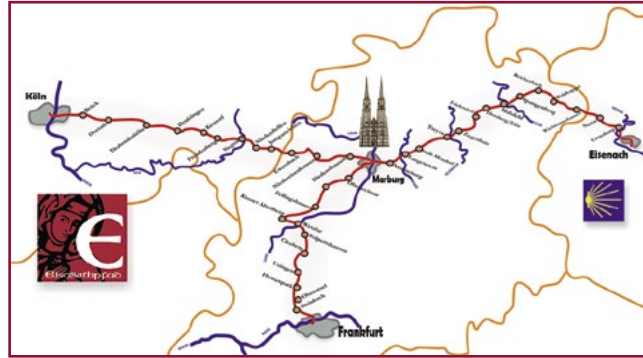
Drei Elisabethpfade führen nach Marburg: E 1 von Frankfurt, E 2 von Eisenach, E 3 von Köln

Herzlich laden wir Dich ein, unsere drei Elisabethpfade mitten in Deutschland hin zur Grabeskirche der heiligen Elisabeth zu nutzen. Gerade in Zeiten wie diesen, wo sich mehrere Krisen überlagern und für viele Menschen die Zukunft im Nebel verschwindet, kann der Aufbruch zu einem Pilgerweg erden und neues Vertrauen wachsen lassen.