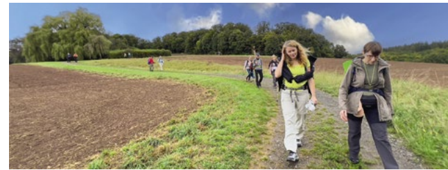
Pilger und Pilgerinnen in der Gruppe auf dem Elisabethpfad 1.

Wandern mit spirituellem Rahmen fördert die Gesundheit von Leib und Seele. Das bewusste und meditative Gehen eines Weges hilft sehr, den eigenen Lebensweg zu bedenken und neue Orientierung zu gewinnen.